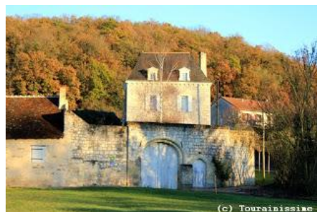
Le manoir privé de Givré date du XVe siècle mais a été modifié au XVIIIe siècle. Son entrée présente une double porte charretière et piétonne.