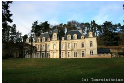
Le château privé de Sonny a été reconstruit au XIXe siècle. L'édifice primitif était du XVe siècle.