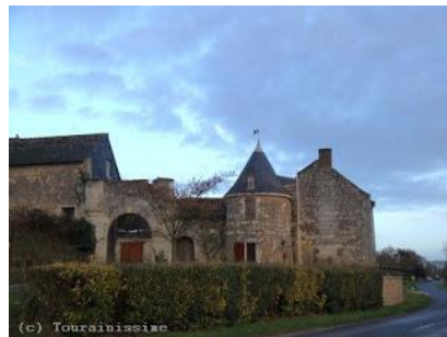
Le manoir privé de Nueil ou Neuil (XVIe siècle) présente une porte fortifiée en plein cintre, accompagnée par une poterne, et deux tours transformées en pigeonniers. Au sud, en bordure de la route, se trouve un long bâtiment du XVIIe siècle élevé d'un rez-de-chaussée et d'un comble éclairé par des lucarnes à fronton courbe. Deux frontons triangulaires surmontent des oculi.