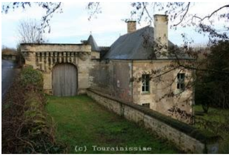
Le manoir privé des Berthaisières (XVIe siècle) possède un portail, accompagné d'un guichet, fortifié de 1574. Le logis présente une tour polygonale d'escalier à vis.