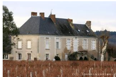
Le manoir privé de La Bellonnière a été bâti au XVe siècle et remanié au XVIIIe siècle (façade est). Sa façade ouest, avec une tour polygonale d'escalier, a gardé l'aspect de la construction primitive. A l'intérieur, deux cheminées datent du XVIIIe siècle. La Bellonnière était un fief relevant de Cravant.