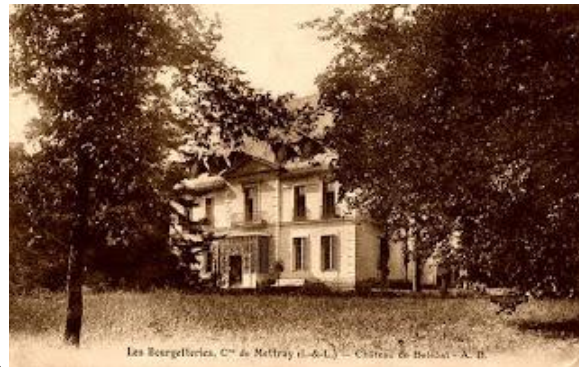
Les Borgeilles, C m de Mettray (I.-et-L.) — Château de Bel-Ébat - A. B.

Le château privé du Petit-Bois a été bâti en 1841 pour le vicomte Herman de Courteilles. Sa chapelle rectangulaire présente une abside semi-circulaire. Ce domaine était un fief qui fut réuni à celui de Mettray au XVIIIe siècle