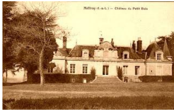
Mettray (I.-et-L.) — Château du Petit Bois

Le château privé de La Ribellerie , édifié au XVIIIe siècle, comprend un rez-de-chaussée et un étage mansardé. Le fief relevait de Mettray.