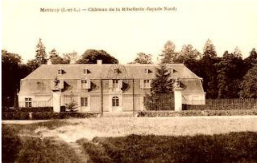
Mettray (I.-et-L.) — Château de la Ribellerie (façade Nord)

Derrière le logis seigneurial, on aperçoit ce pigeonnier cylindrique du XIXe siècle.