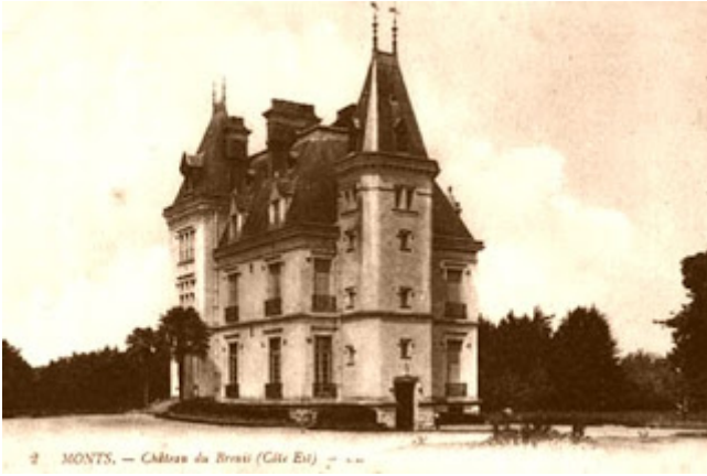
Le château privé du Breuil a été édifié en 1881 dans le style néo-Renaissance.