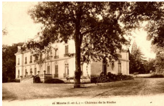
Le château privé de La Roche a été rebâti au XVIIIe siècle et agrandi en 1856. Il se trouve sur l'emplacement d'une ancienne forteresse dite, au XVIe siècle, La Roche-Preston.

Dans le parc de ce château, le manoir du Vieux-Breuil (XVIIe siècle) a subsisté. Il a conservé ses multiples toitures et une cheminée monumentale, datant de la première Renaissance, qui provient du manoir disparu de La Tardivière.